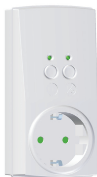
EL-nr: 5449903 230 volt